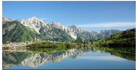
白馬八方尾根環境保全の取組を学

豊かな自然や美しい景観、独自の伝統文化が今でも暮らしの中に息づく長野県は、多彩な学習テーマで地域を巡ることができ、SDGsの観点での学びに修学旅行としての魅力的な destinations です。「自然に学ぶ」「暮らし・文化に学ぶ」をテーマの中心とした教育旅行素材を直接体感できる絶好の機会です！