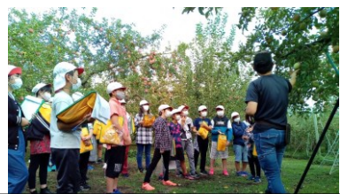
松川町くだもの畑ガイドウォーク