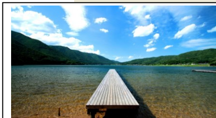
大町「水の学校」未来の水を考える