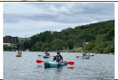
白樺湖 カヌー体験